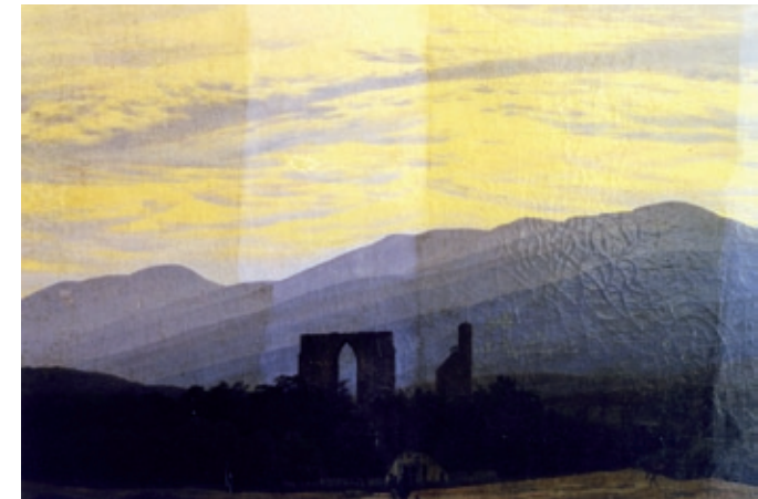
Firnisaufnahme im Zuge der Restaurierung des Gemäldes „Ruine Eldena im Riesengebirge“ von C. D. Friedrich (Pommersches Landesmuseum) im Jahre 2003