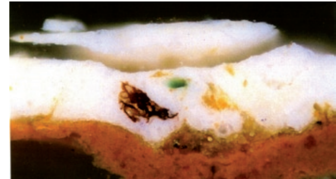
Querschnitt eines winzigen Gemäldepartikels, an dem sich der Aufbau der verschiedenen Mal- und Grundierungsschichten ablesen lässt.

Der hohe Rang des Gemäldes von Caspar David Friedrich erfordert eine eingehende Voruntersuchung. In Zusammenarbeit mit dem Lehrstuhl für Konservierung und Restaurierung von Gemälden an der Hochschule für Bildende Künste Dresden, der seit Ende des Jahres 2007 über die modernste Anlage für infrarotreflektografische Bilduntersuchungen verfügt, wird die strahlendiagnostische Untersuchung durchgeführt. In Fortführung der Forschungen zur Maltechnik Friedrichs sind hier interessante Ergebnisse zu erwarten. Das schließt auch analytische chemische Untersuchungen der materiellen Komponenten des Gemäldes mit ein.