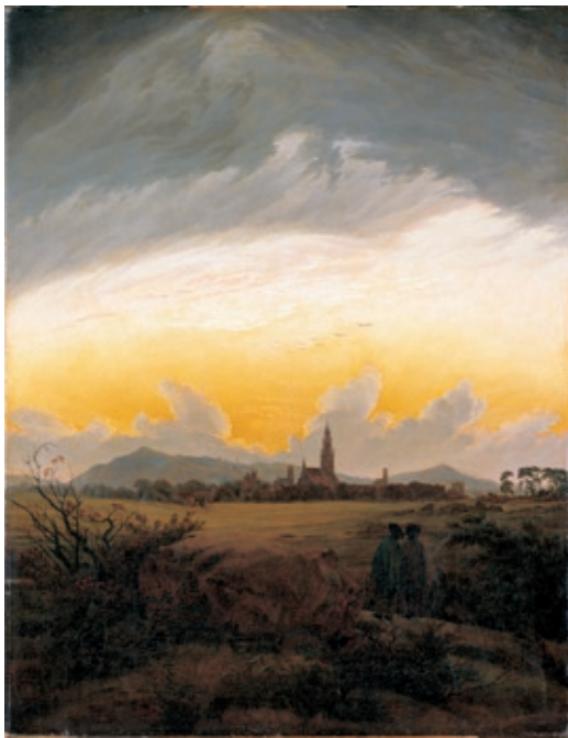
Caspar David Friedrich (1774–1840), „Neubrandenburg“, um 1816/17, Öl auf Leinwand, 92 x 71,5 cm