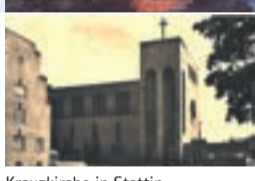
Kreuzkirche in Stettin