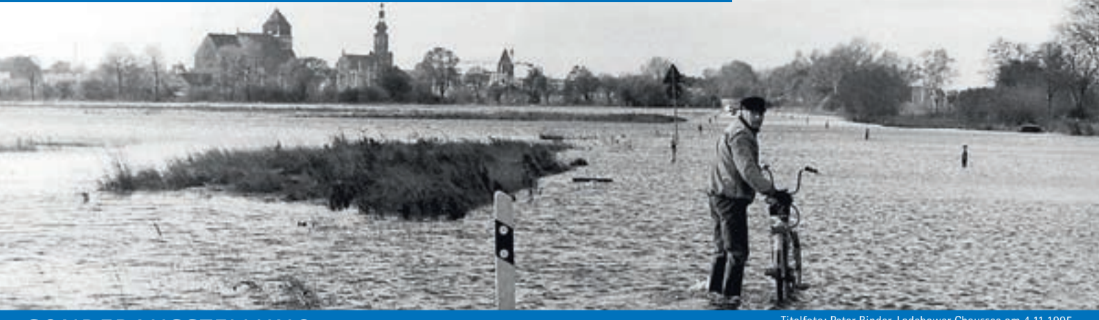
Ladebower Chaussee am 4.11.1995